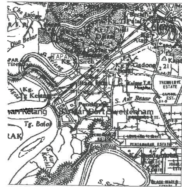
PELAN KUNCI SKALA: SATU BATU SEINCI